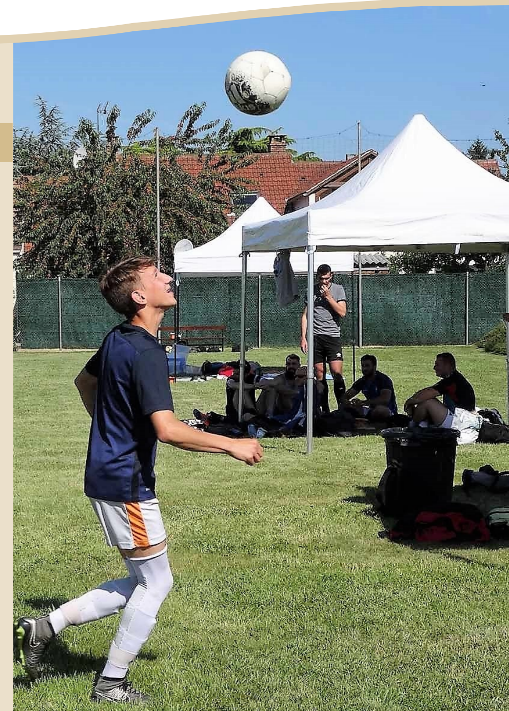
TOURNOI DE FOOT le 17 juin