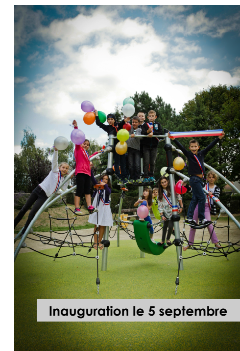
Inauguration le 5 septembre