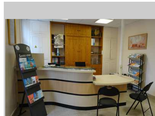
Mise en conformité de l'accueil de la mairie réalisée en septembre 2015

L'ensemble des travaux de mise en conformité s'échelonnent jusqu'en 2018.