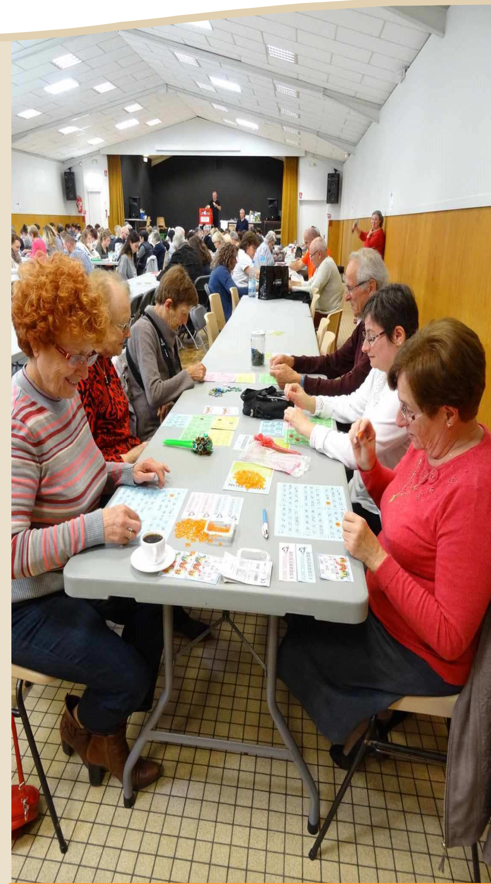
La salle des loisirs a accueilli son premier LOTO le 9 octobre